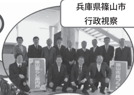
活動 スナップショット