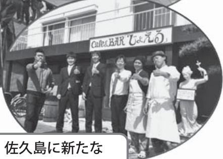
佐久島に新たな カフェ登場