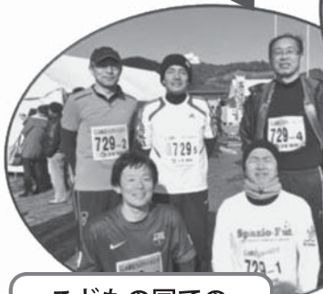
こどもの国での 駅伝大会